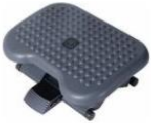
Reposapiés de Oficina Ajustable Ergonómico...